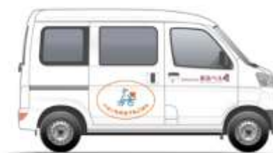
「ベネッセのおうちごはん」の新規エリアにおける配送を受託する東急ベルの配送車およびベルキャストの制服には、「ベネッセのおうちごはん」のロゴと「Delivered by 東急ベル」と表記されます。

東急は今後も、生活を便利で快適にするサービスを拡充し、より豊かな沿線生活の実現をサポートし、沿線地域を活性化させることで「日本一住みたい沿線」を目指します。